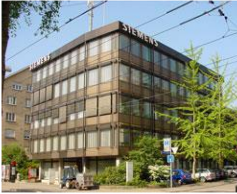
Belpstrasse 26, direkt bei Tram-Haltestelle «Hasler»