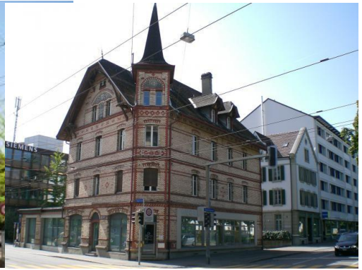
Walkerhaus Belpstrasse 24